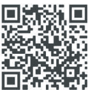
Gemeinde Dettingen auf WhatsApp

Scannen Sie dazu die untenstehenden QR-Codes und bleiben Sie immer auf dem Laufenden.