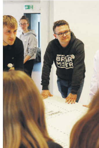
Im „World Café“-Format erarbeiteten die Jugendlichen gemeinsame Ideen für ihre Gemeinde.

Ein weiterer wichtiger Schritt im Projekt zur Jugendbeteiligung ist gelungen: Am 30. März 2026 fand im Feuerwehrhaus Dettingen der erste Workshop mit den Jugendlichen statt – mit großer Resonanz. Über 70 Jugendliche sowie mehrere Jugendleiterinnen und Jugendleiter aus den örtlichen Vereinen nahmen teil.