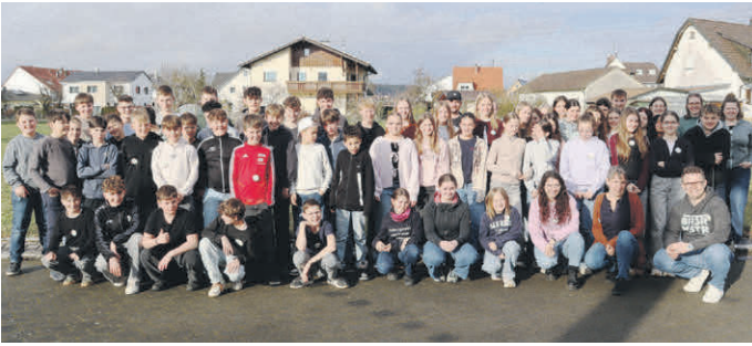
Über 70 Jugendliche aus Dettingen beteiligten sich am Workshop.